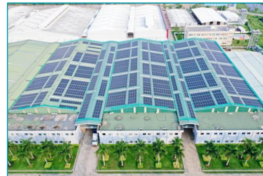
Tuntex, Châu Thành, Sóc Trăng - 2022