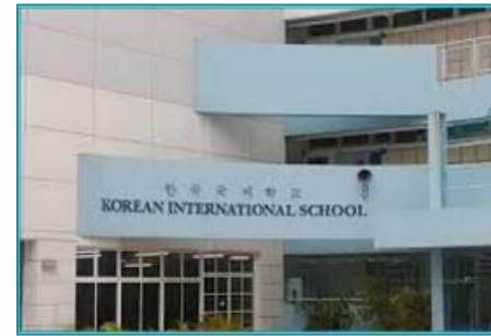
Trường quốc tế Hàn Quốc Q7, TP.HCM - 2020