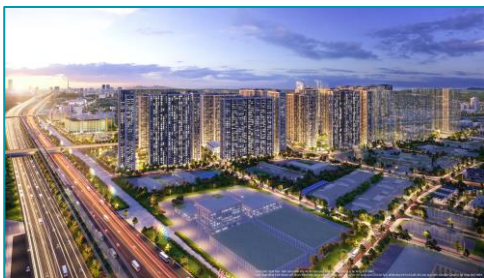
Vinhomes Smart City HN - 2022