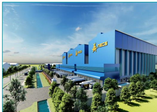
Kho lạnh Kỷ Nguyên Mới NECS - 2022