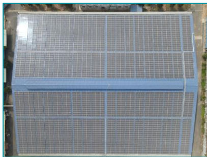
May Nhà Bè - xưởng Bình Phát Đĩ An, Bình Dương - 2020