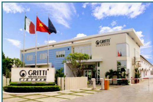
Gritti, Thuận An Bình Dương - 2022