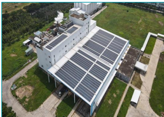
Tata Coffee Tân Uyên, Bình Dương - 2022