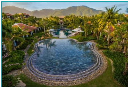
Khu nghỉ dưỡng The Anam Cam Ranh, Khánh Hòa - 2020