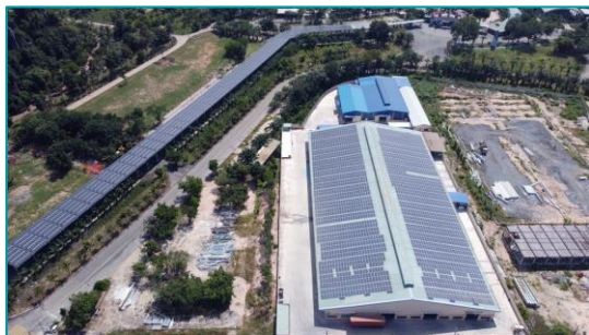
Xưởng Ngũ Lân - 2020