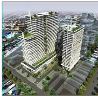
Viettel Complex Q.10 HCM - 2020