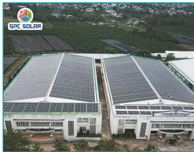
Xí nghiệp May Bảo Lộc Lâm Đồng - 2020