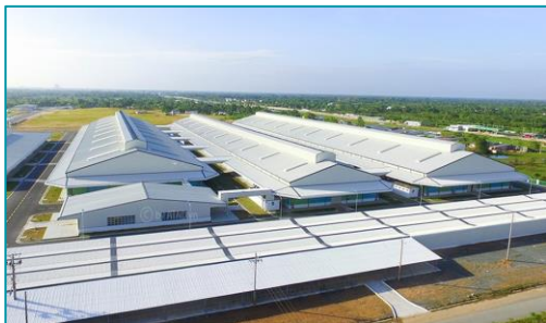
Chuỗi Taekwang, Cần Thơ + Đồng Nai - 2022