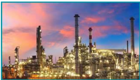
Lọc hóa dầu Long Sơn Vũng Tàu - 2020