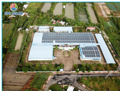
Vinatex Vĩnh Thạnh, Cần Thơ - 2020