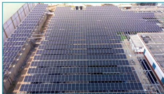
NM XL nước thải Sóng Thần 2+3 Bình Dương - 2020, 2019