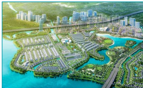
Vinhomes Grand Park - 2022