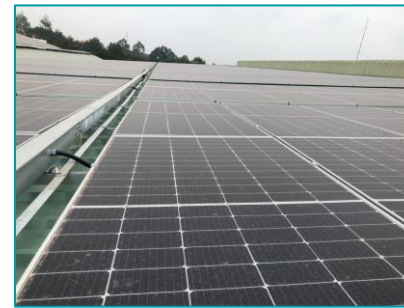
Hoàng Nguyên Solar - 2020