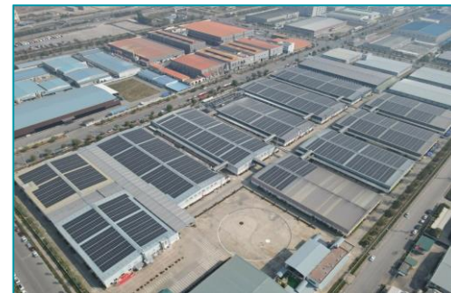
Foxconn New Wing Vân Trung, Bắc Giang - 2022