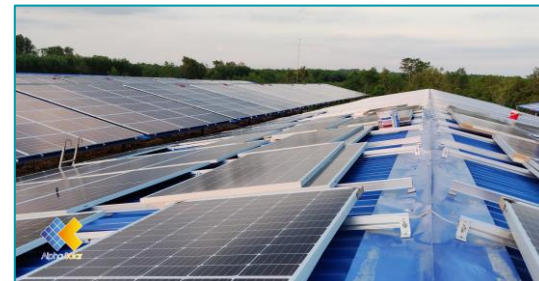
Trại gà sạch Vũng Tàu - 2020