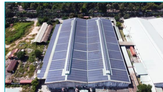
Xưởng Hân Xương - 2020