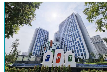
FTI Cầu Giấy - 2022