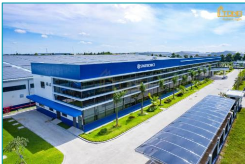
Spartronics, Tân Uyên, Bình Dương - 2022