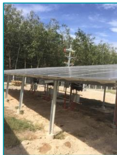
Nhiều dự án Ninh Thuận, Bình Thuận - 2020