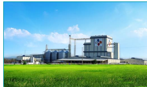
Chuỗi CJ Agri - 2022