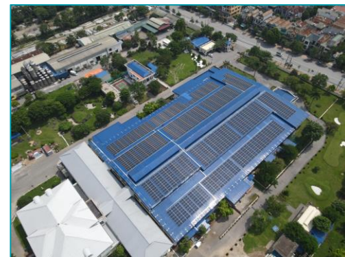
R Technical Research Hòa Bình - 2022