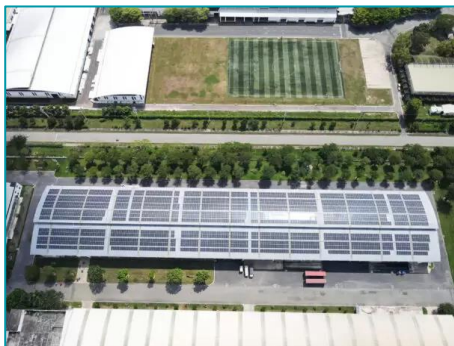
SanFang, Phú Mỹ, Bà Rịa Vũng Tàu - 2022