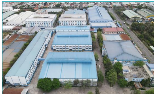
Diamond, Bến Cát, Bình Dương - 2022