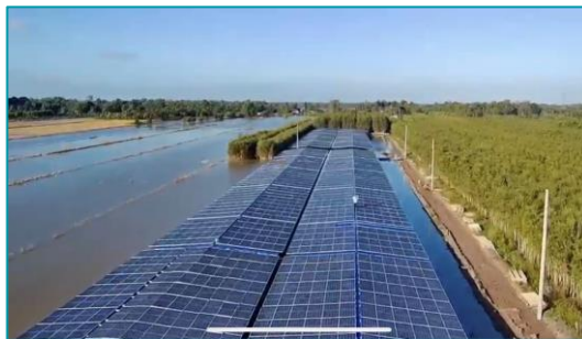
Trại gà + điện mặt trời HA 1,2,3 Hòa An, Hậu Giang - 2020