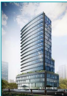
The 678 Tower PMH, TP.HCM - 2020