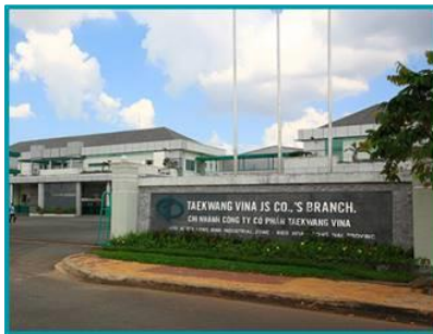
Nhà máy Taekwang Đồng Nai - 2019