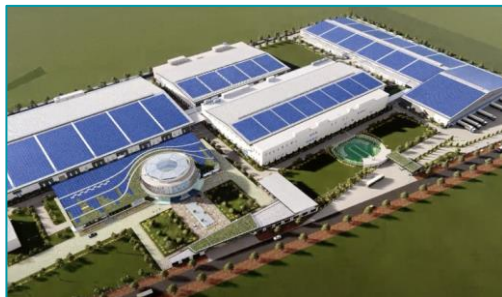
Saitex Fabrics, Nhơn Trạch, Đồng Nai - 2022