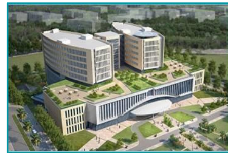
Bệnh viện 175, Khu hậu cần TP. HCM - 2019