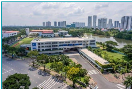
Trường quốc tế Nam Sài Gòn Q7, TP.HCM - 2020