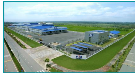
Nhà máy KCC Nhơn Trạch, Đồng Nai - 2020