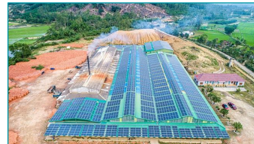
Gạch Hùng Nghĩa Quảng Ngãi - 2020