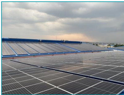
Nhà xưởng Unitek Bình Dương - 2020