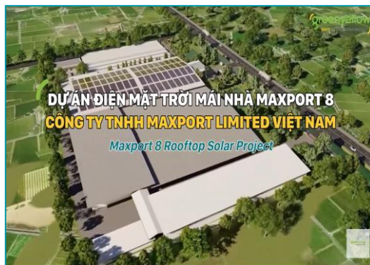
Maxport 8, Hải Hậu, Nam Định - 2022